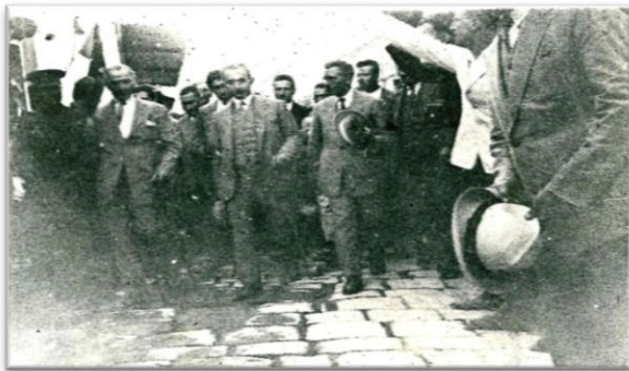
Gazi Mustafa Kemal Paşa Urla'da. 8 Temmuz 1926.

30 Haziran ile 8 Temmuz tarihleri arasında Çeşme'de kalan Gazi Mustafa Kemal Paşa, 8 Temmuz 1926 Perşembe günü İzmir'e dönmek üzere Çeşme'den ayrılmıştır. Bu dönüş yolculuğunda da yine yol güzergâhında bulunan Urla'ya da uğramışlardır.