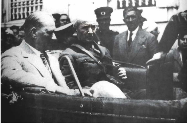
Mustafa Kemal Atatürk, İsmet İnönü ile birlikte İzmir'de.

20 Haziran günü Başbakan İsmet Paşa, 29 Haziran günü de Genelkurmay Başkanı Fevzi Paşa İzmir'e gelmiştir. Atatürk, 30 Haziran günü, Başbakan İsmet İnönü, İzmir Valisi Kazım Dirik ve beraberindeki heyetle birlikte İzmirliilerin kendisine armağan etmiş olduğu Naim Palas'tan ayrılarak Çeşme'ye doğru yola çıkmıştır.