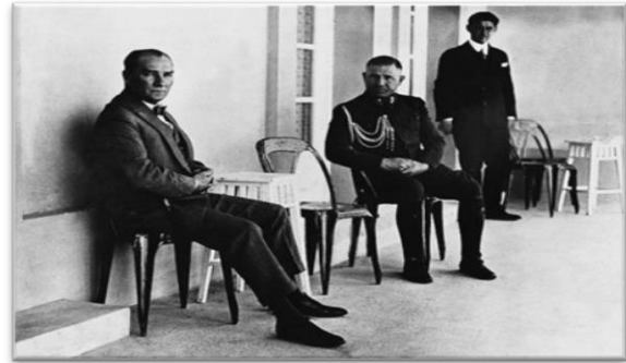
Gazi Mustafa Kemal Paşa Çeşme'de. Temmuz 1926.