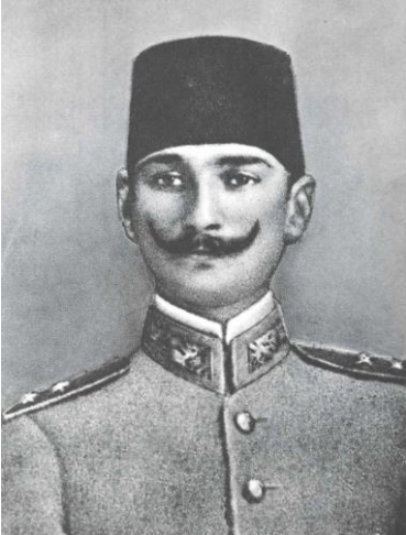
1905-Kurmay Yüzbaşı Mustafa Kemal Atatürk, Şam'daki 30. Süvari Alayı'nda görevli iken.

Mustafa Kemal, Şam'a sürgün edildiğinde Payitaht'tan Suriye'ye giderken İzmir'e uğramıştır. Dönemin şartları gereğince gemi yolculuklarında, Urla Karantina Adası'nda karantinaya girmek zorunluluktur. Bu bağlamda Mustafa Kemal, Şubat 1905 tarihinde İzmir'i, dolayısıyla Urla'yı ilk kez ziyaret etmiştir.