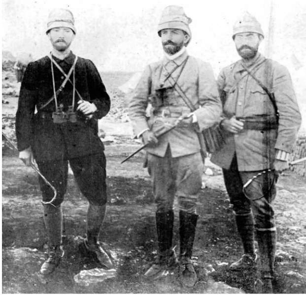
Kurmay Binbaşı Mustafa Kemal Atatürk, Derne'de.