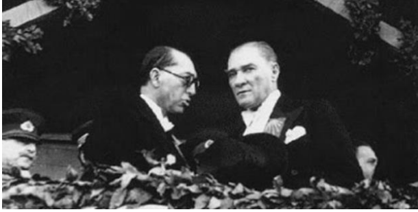
Mustafa Kemal Atatürk, uzun yıllar görev yapmış Dışişleri Bakanı Dr. Tevfik Rüştü ARAS ile birlikte.

Mustafa Kemal, 1907 yılında Şam'dan Selânik'e giderken İzmir'e, dolayısıyla Urla'ya uğramıştır.